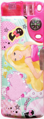
กล่องดินสอ