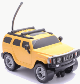
รถบังคับวิทยุ